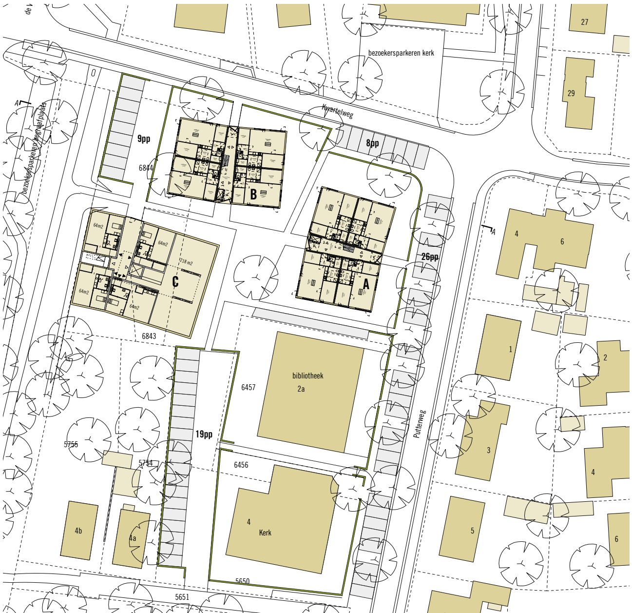
Plattegrond nieuwe situatie.