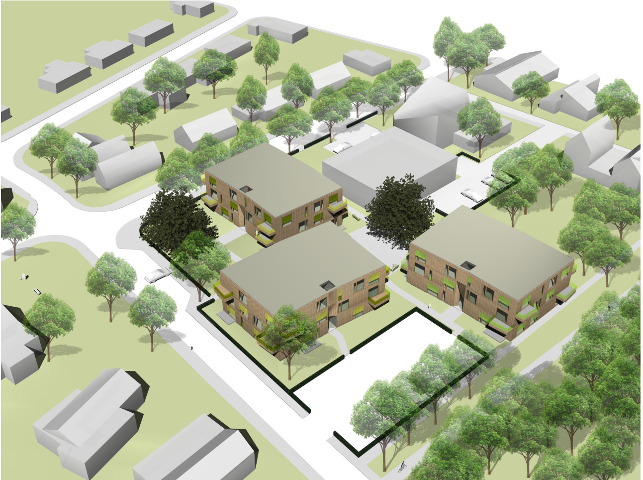
Vogelvluchtperspectief vanuit het noord-westen.